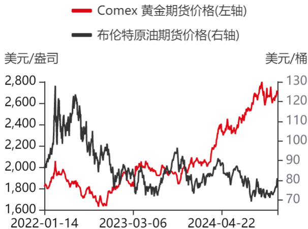
图5：原油期货与金价走势对比