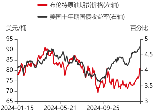
图3：原油期货与美债收益率走势对比