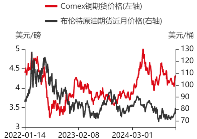
图4：原油期货与铜价走势对比