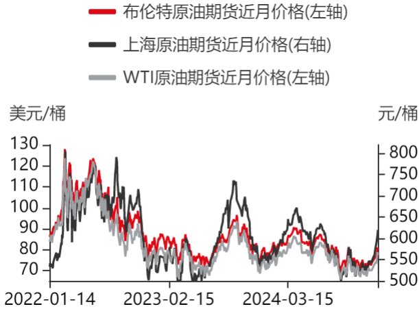
图1：原油期货价格走势