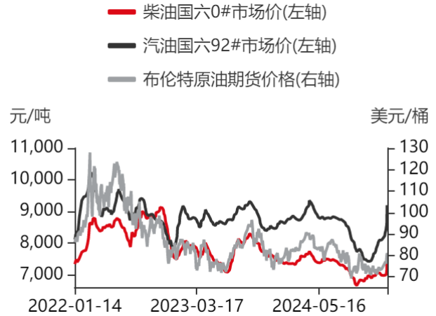
图2：原油期货与国内成品油价格走势对比